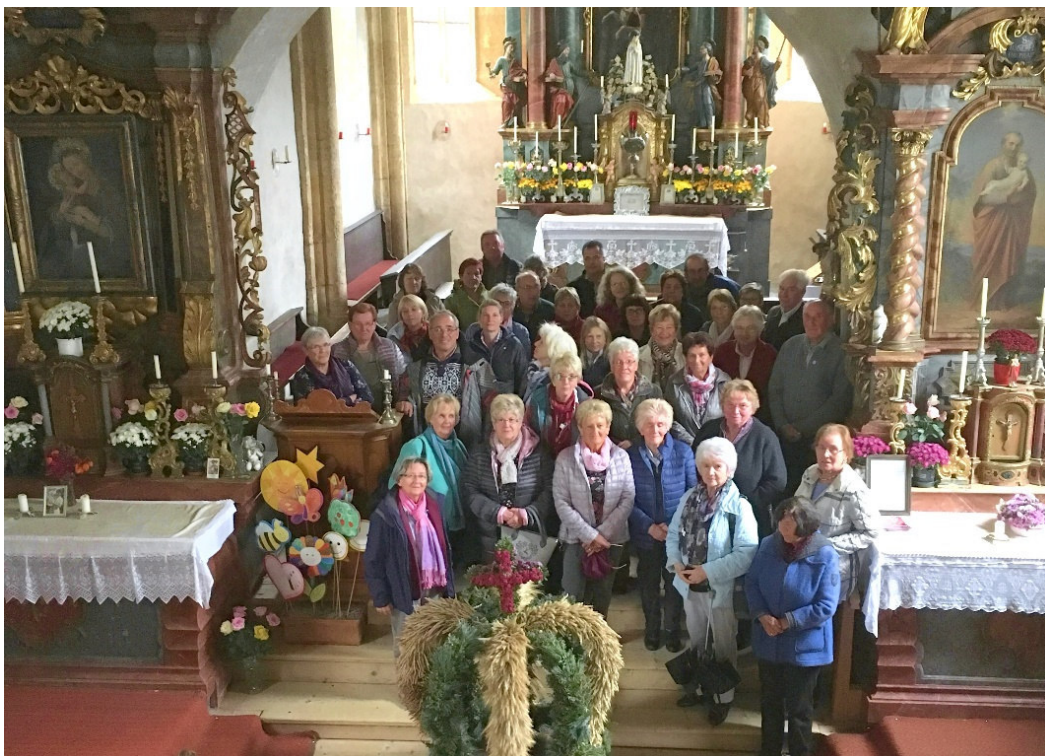
Die Ausflügler in der Pfarrkirche Thomatal