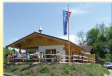
Cafe s' Bamstoa

Barnsteinweg 7 Tel.: 08650/ 1307 www.bamstoa.de