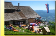
Toni Lenz Hütte

am Untersberg geöffnet Mai bis Oktober Tel.: 0043 660 658 1430 www.toni-lenz-huette.de