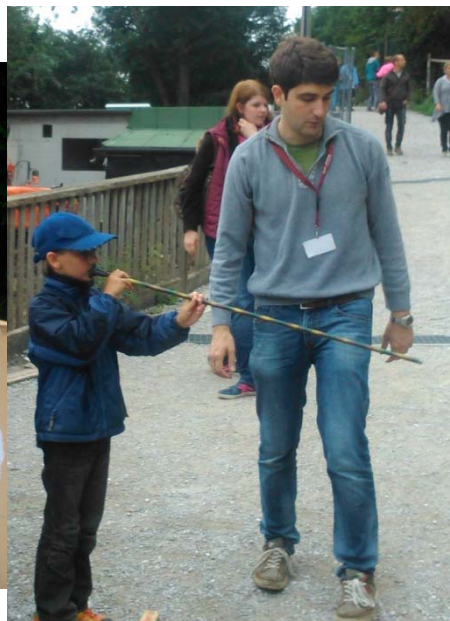
Autor: Stefan Hurter