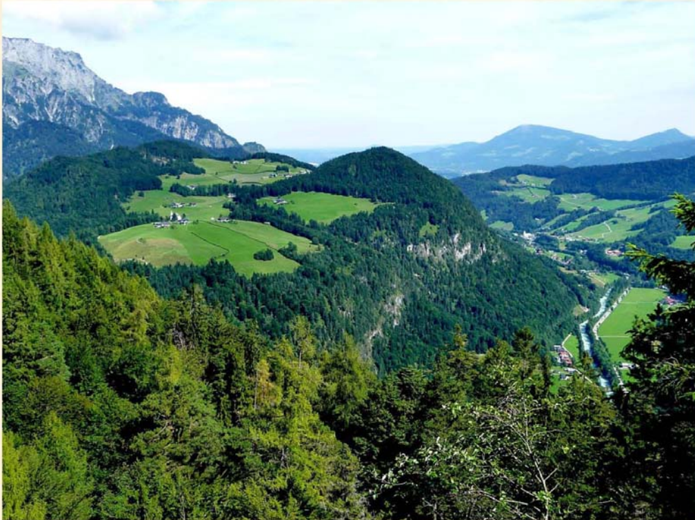
Blick von der Kniefelspitze auf die Kirchen Ettenberg und Marktschellenberg