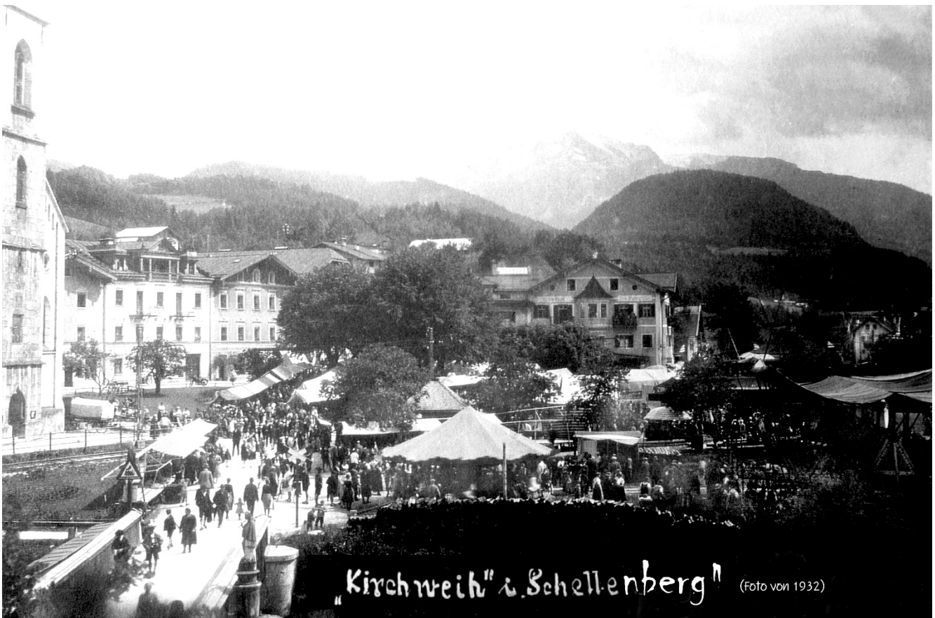
„Kirchweih“ in Schellenberg (Foto von 1932)