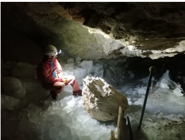
Die Umgehung des Steines der Weisheit