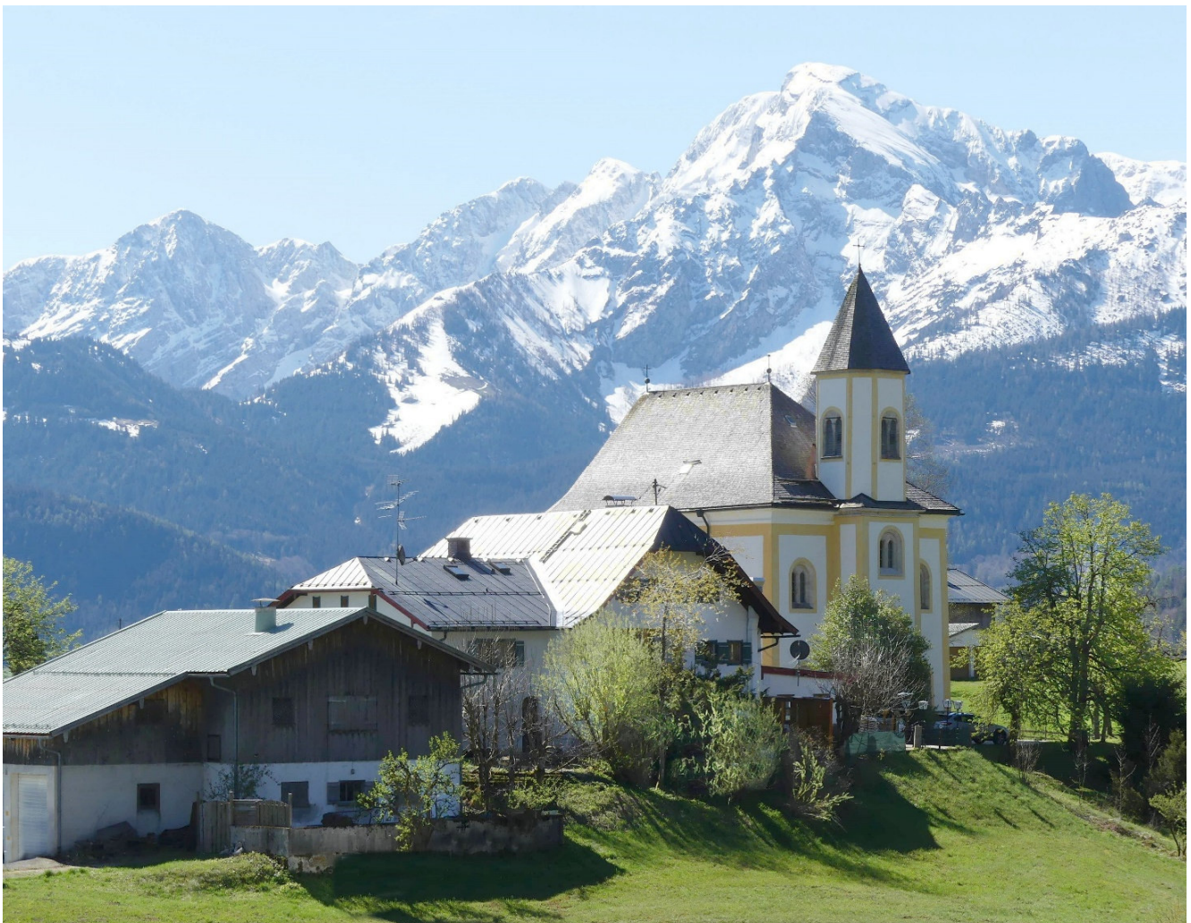
Wallfahrtskirche Mariä Heimsuchung in Ettenberg mit Blick zum Hohen Göll